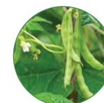
豆类 15-20 kg/亩