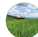
大田作物 25-30 kg/亩