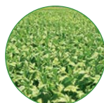
烟草 25-30 kg/亩