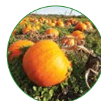
果菜类 35-40 kg/亩