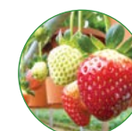
草莓 25-30 kg/亩