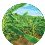
香蕉 0.5-1 kg/株