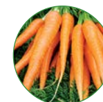
胡萝卜 35-40 kg/亩