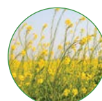
油菜 20-25 kg/亩