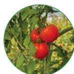
西红柿 35-40 kg/亩