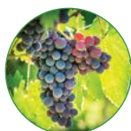
葡萄 35-40 kg/亩

所有的化学分析依据欧盟2003/2003肥料规程分析；含硼，可进行微量元素分析。