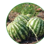
西瓜 20-25 kg/亩