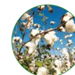
棉花 25-30 kg/亩