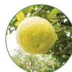
蜜柚 1-1.5 kg/株