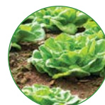
叶菜类 25-30 kg/亩