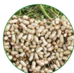
花生 25-30 kg/亩