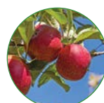
苹果 1-1.5 kg/株