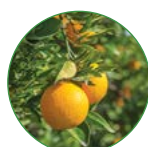
柑橘 1-1.5 kg/株