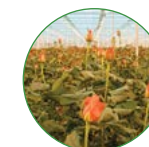
花卉 25-30 kg/亩

以上数据仅供参考，请根据与其他肥料配合的情况和土壤地力水平确定用量，适当增减，具体请咨询当地农技人员或经销商。