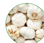
大蒜 20-25 kg/亩